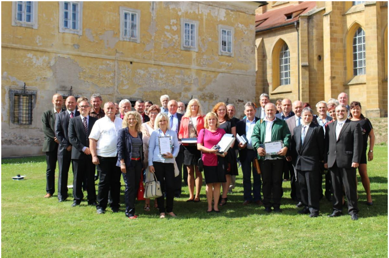
Zástupci všech oceněných obcí na společném snímku 11. ročníku soutěže My už odpad třídíme.

Stejně jako v loňském roce, tak i v letošním ročníku, byly do soutěže automaticky zařazeny všechny obce a města, které byly v roce 2015 zapojené do celorepublikového systému třídění a využití odpadů společnosti EKO-KOM, a.s. Soutěže se zúčastnilo celkem 486 obcí a měst kraje. Soutěž je rozdělena do dvou kategorií, v první kategorii soutěžily obce do 1000 obyvatel, ve druhé pak města a obce nad 1000 obyvatel.